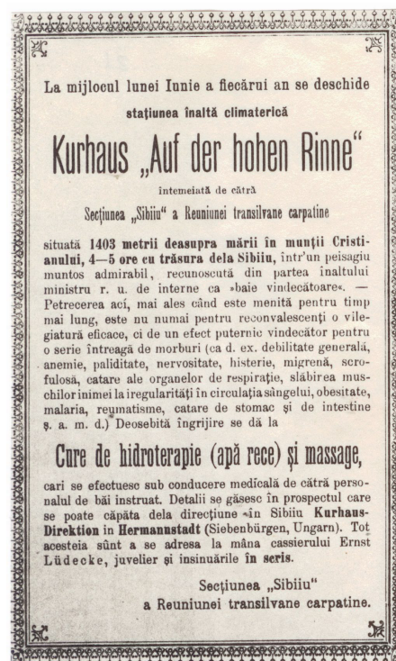
Fig. 1. Reclamă pentru Casa de Cură Păltiniș inserată în „Călăuzul pentru Sibiu și împrejurime”, publicat de S.K.V. în 1903.

Oaspeților li se solicita inclusiv un consult medical prealabil în vederea stabilirii unui program optim de cură, asigurându-li-se permanent la Păltiniș și o asistență medicală de specialitate. În Fig. 1 este redată o reclamă pentru Sanatoriu inserată în Călăuzul pentru Sibiu și împrejurime publicat de S.K.V. în 1903, care, în pitorescul grai ardelenesc al vremii, specifică afecțiunile cărora un sejur la Hohe Rinne era menit să le aducă alinare 3 .